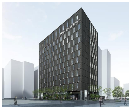
完成予想イメージ ※今後、変更となる場合がございます。

当施設は、三井不動産グループが運営するホテルとして、福岡市内では、現在建設を進めております「(仮称)博多駅前二丁目ホテル計画（2019年夏 開業予定・約300室）」に続いて2軒目、九州では「三井ガーデンホテル熊本（熊本市中央区・225室）」を含め、3軒目となります。