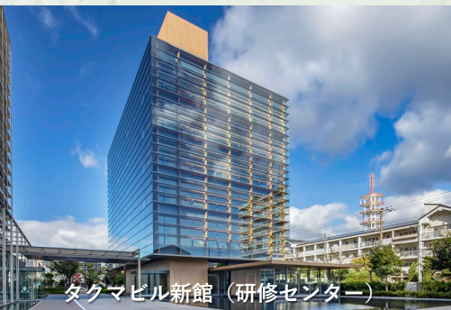
タクマビル新館（研修センター）