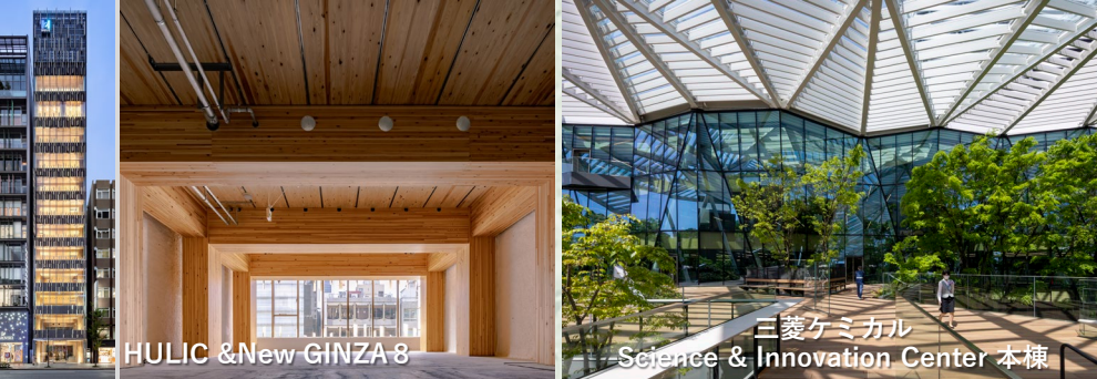
HULIC & New GINZA 8