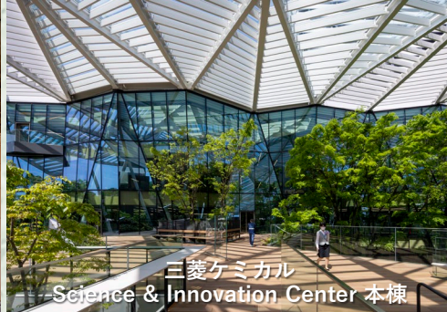
三菱ケミカル Science & Innovation Center 本棟