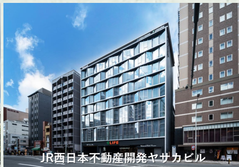
JR西日本不動産開発ヤサカビル