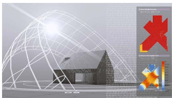
日照パターンのシミュレーション