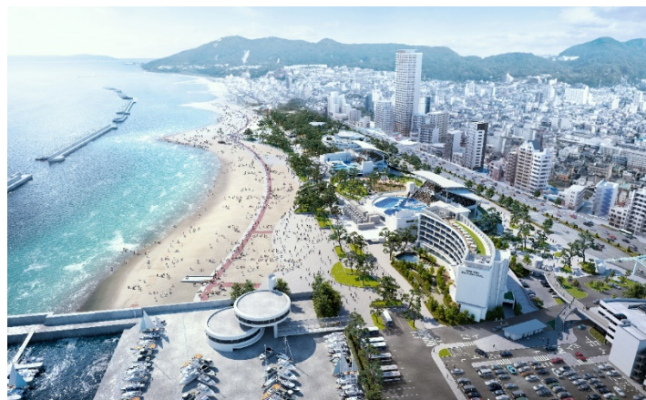
再整備後イメージ