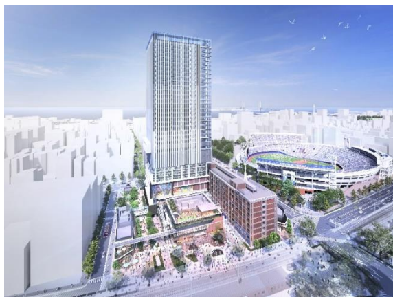
街区全体完成予想パース（昼イメージ）

街づくりコンセプトには「MINATO-MACHI LIVE（みなとまち ライブ）」を掲げ、「新旧融合」を特色に、「ザ レガシー」（旧横浜市庁舎行政棟）を保存・活用し横浜の文化を継承し、格式ある景観を形成します。また、次世代の横浜を象徴するエンターテインメント&イノベーションの拠点となり、新たな感動とにぎわいの源泉となる街を創造します。