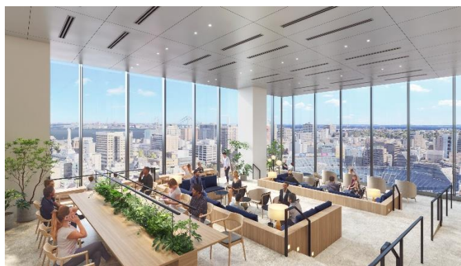
11 階スカイロビー ラウンジ完成予想パース(昼景)