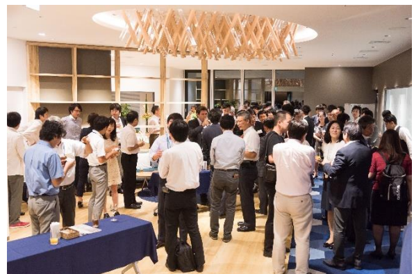
LINK-J によるイベントネットワーキング風景