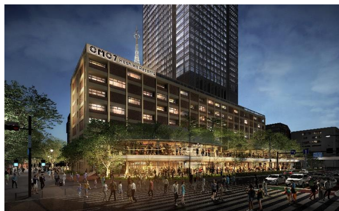
OMO7 横浜 by 星野リゾート 完成予想パース