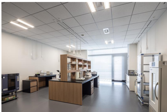
三井リンクラボ 賃貸ラボ区画イメージ (画像は三井リンクラボ新木場 2)

https://www.mitsufudosan.co.jp/corporate/news/2022/0310_02/