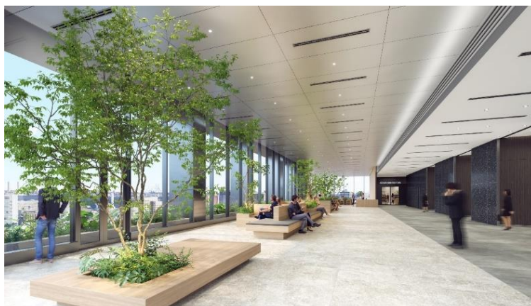
11 階スカイロビー完成予想パース

港町・横浜を一望しながら、企業の枠を超えたオフィsfloアワーカー同士の交流やイノベーション創出を促進するラウンジ、コワーキングやシェアオフィsfloアを含む、様々な交流が生まれるイノベーション促進施設を整備する予定です。