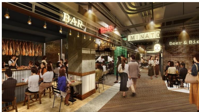
国内最大級 小型店舗が集う飲食ゾーン 完成予想パース