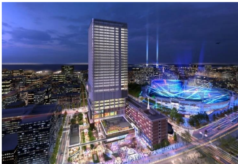
街区全体完成予想パース(夜景イメージ)

本プロジェクトは、多種多様な施設計画と旧横浜市庁舎行政棟の保存・活用により、次世代の横浜を象徴するエンターテインメント&イノベーションの拠点となる、「新旧融合」を特色とした大規模ミクストユース型プロジェクトです。本街区の特徴的な施設である日本最大級の常設型ライブビューイングアリーナ、エデュテインメント施設、ホテル名称、オフィスや新産業創造拠点の名称や概要についても決定しましたのでお知らせいたします。