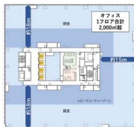
オフィsfloア高層バンク平面