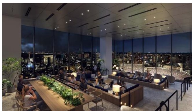
11 階スカイロビー ラウンジ完成予想パース(夜景)

また、日射を考慮した外装の開口設定、Low-E 複層ガラスの全面採用、熱回収システムの導入等による熱負荷の軽減に加え、個別空冷ヒートポンプパッケージエアコン等の高効率設備導入により省エネルギーを実現し、オフィsfloア部分については、「CASBEE ウェルネスオフィsfloア S ランク」「ZEB Oriented」の環境認証を取得しました。タワー棟では、「DBJ Green Building 認証」を取得予定です。