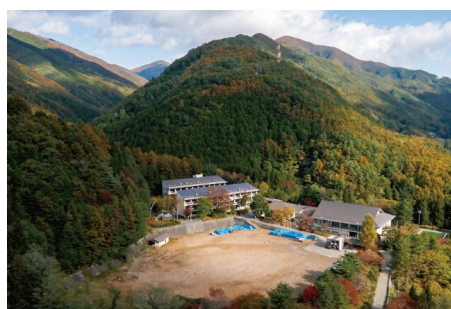
yama-niwa 全景（旧榎川中学校）