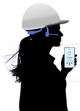
スマートな使用感(イメージ)